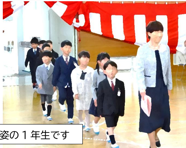
4/9入学式 立派な姿の1年生です